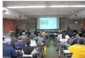
昨年度プレゼンテーションの様子