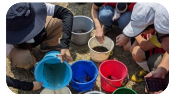
写真は2023年度の体験学習の様子です